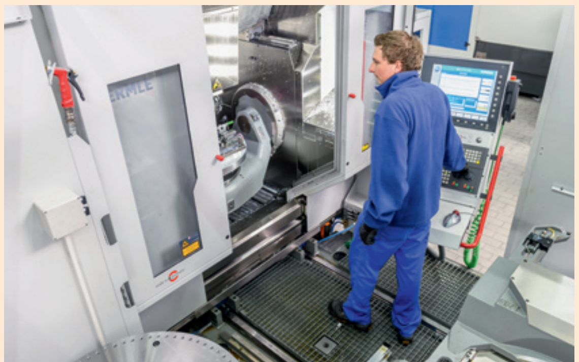
Adequate Solutions hat alle Maschinen über eine Integration zur Postprozessor-Entwicklungsumgebung von MR an »Topsolid Cam« angebunden.

Die Notwendigkeit, die neue CAM-Lösung in die bestehende IT-Landschaft zu integrieren, war ein wesentliches Kriterium bei der Auswahl von Topsolid und der ausschlaggebende Grund für die Wahl von Adequate Solutions als