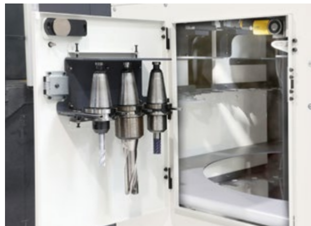
Ergonomische Beladeluke für bis zu 3 Werkzeuge gleichzeitig