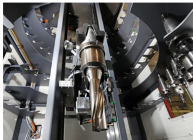
Das Werkzeug immer im Griff: Die Greifer können auf Wunsch auch verschiedene WZ-Aufnahmen gleichzeitig handhaben