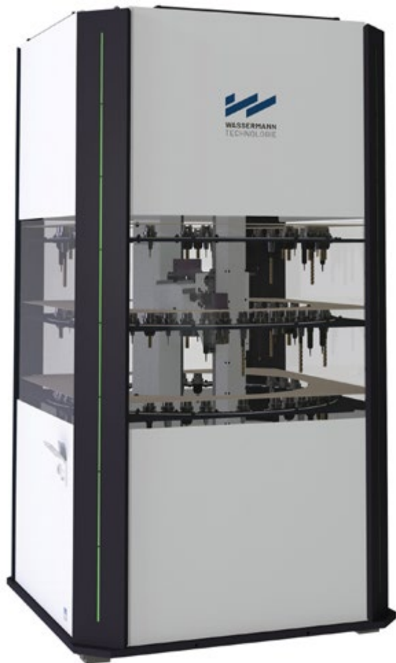
Der kompakte Werkzeug-TERMINAL für bis zu 350 zusätzliche Werkzeuge an Ihrer Maschine

Der kompakte Werkzeug-TERMINAL für Ihre Maschinenerweiterung