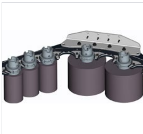
Aufteilung für HSK63, PSC 63, SK40, BT40: Links: Standarddurchmesser bis 80 mm Rechts: Durchmesser bis 160 mm bei freien Nebenplätzen