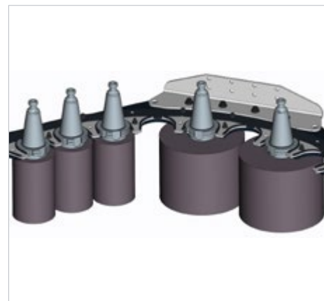
Aufteilung für HSK100, PSC 100, SK50, BT50: Links: Standarddurchmesser bis 125 mm Rechts: Durchmesser bis 280 mm bei freien Nebenplätzen